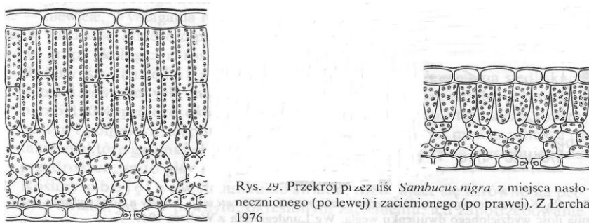
Rys. 29. Przekrój przez liść Sambucus nigra z miejsca nasłonecznionego (po lewej) i zacienionego (po prawej). Z Lercha 1976

Zwiększenie intensywności światła pociąga za sobą zwiększenie transpiracji. Dlatego budowa liści rośliny światłolubnych ma bardziej ksero-morficzny charakter niż liści roślin cieniolutubnych. Schemat przedstawia przekrój przez liść Bzu czarnego z miejsca nasłonecznionego (po lewej) i zacienionego (po prawej).